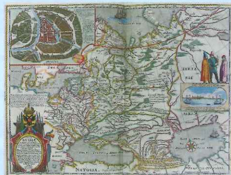
左上に見えるはクレムリン！ 『大地図帳』ヨアン・ヴラウ 1664年 プラント 1698年