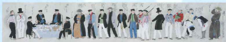
日本・ロシア草の根交流のはじまり 『プチャーチン来航図』1855年