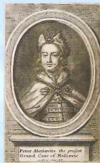
サンクトペテルブルクを建てた ピョートル大帝 『ロシアの中国使節団紀行』 プラント 1698年